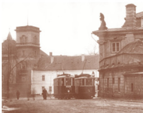
Poválečný snímek z roku 1945 zachytil křížování tramvají na zastávce před Zahradním domem. V pozadí budova zámku.