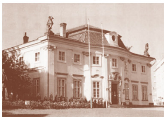
Zahradní dům v osmdesátých letech 20. století. Tehdy zde zmizela část dlažby, kterou nahradil trávnik a parkovou úpravou.