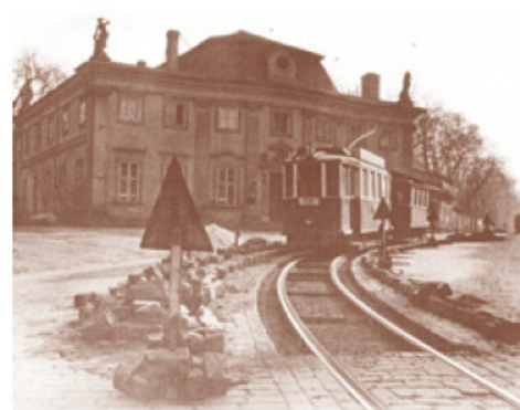
Tramvaj před Zahradním domem na přelomu 40. a 50. let 20. století. Tramvajová souprava na lince číslo 1 směřovala odtud do Dubí.