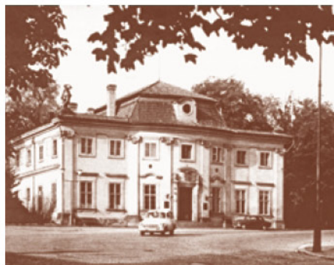
Zahradní dům v šedesátých letech 20. století, kdy už tudy dřívější tramvaje neprojížděly.