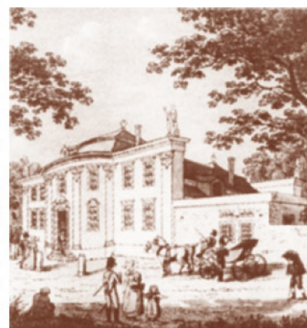
Kresba Zahradního a plesového domu z období baroka v 18. století.