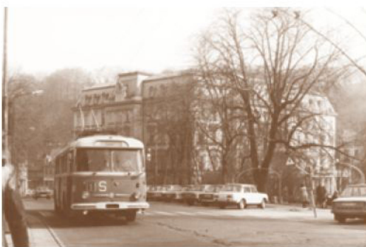
Trolejbus typu 9 Tr 19, ev. č. 136, počátkem osmdesátých let 20. století na lince číslo 1 v ulici U Císařských lázní. Velké S vpředu i na straně vozidla připomínalo, že se jedná o samoobslužný provoz.