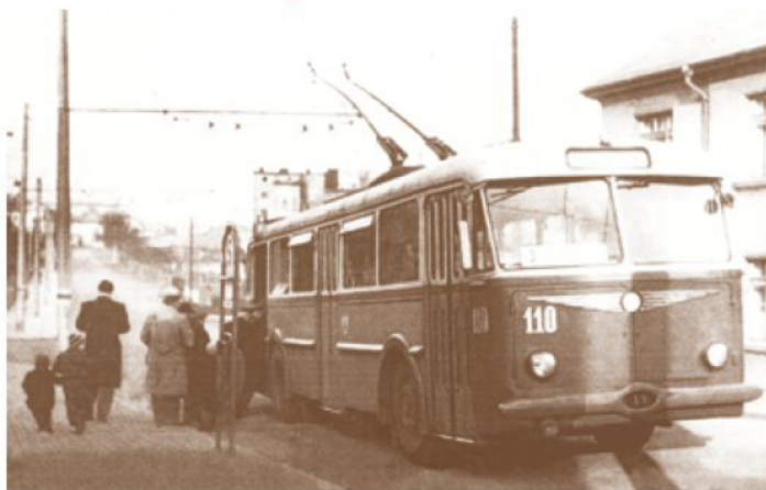
Trolejbus typu 7 Tr, evidenčního čísla 110, na lince číslo 3 v roce 1957. Snímek vznikl v dnes již neexistující zastávce ve Sklářské ulici. Tehdy byla ještě v zadní části vozu umístěna pokladna s průvodčí, proto se nastupovalo pouze zadními dveřmi.

Historie MHD v Teplicích se píše od roku 1895, kdy byly v Teplicích zavedeny první tramvajové linky. O tom jsme už několikrát psali, ale tentokrát se zaměříme na teplické jízdné, na měnící se ceny v průběhu staletí i na různé způsoby odbavování cestujících.