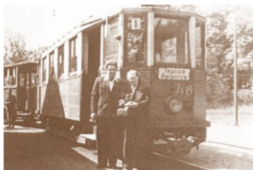
Takíka legendární řidič MHD Jiří Vopravil spolu s průvodčí u tramvajového motorového vozu evidenčního čísla 16 na konečné linky číslo 1 kolem roku 1950.