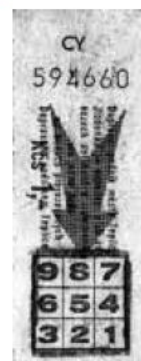
Vlevo: Tramvajová jízdenka z roku 1947. Vpravo: Jízdenka z dob mechanického odbavování ve strojích se používala zejména v osmdesátých letech. Jejich platnost ukončil rok 1991.

tý druh dopravní trakce, neboť tehdy v Teplicích souběžně jezdily dráha, autobusy i trolejbusy.