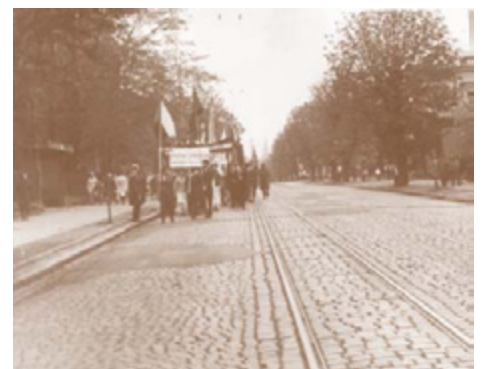
Fotografie pořízená 1. máje 1971 v dnešní Masarykově ulici dokládá, že ještě dlouho po zrušení tramvají zůstávaly na některých místech koleje.