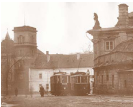
Na snímku z roku 1953 je na Masarykově ulici v Teplicích zachycena tramvajová souprava vedená motorovým vozem č. 49, který jezdil v několika městech a do dneška přežil v Jablonci n. N.