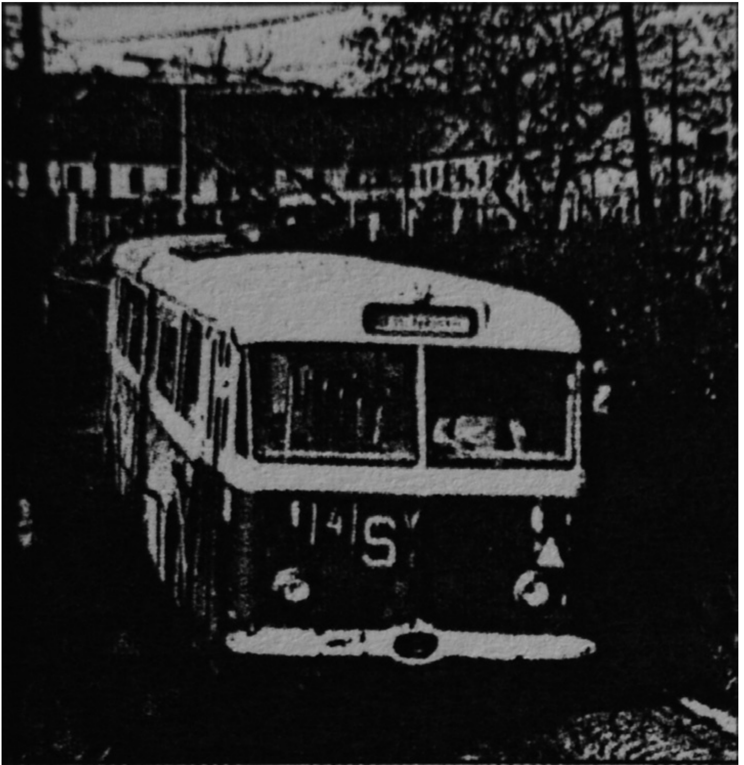
Trolejbusy typu Škoda 8Tr jezdily po Teplicích v letech 1957 až 1980. Snímek byl pořízen v roce 1974 u podjezdu pod tratí Českých drah nedaleko sídla Dopravního podniku Teplice s.r.o.