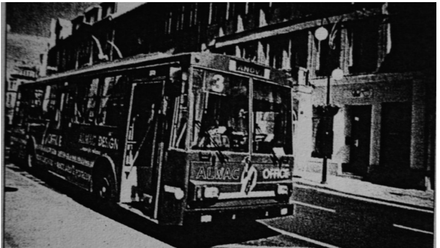
Současným nejrozšířenějším typem trolejbusů v Teplicích jsou vozy řady 14Tr.