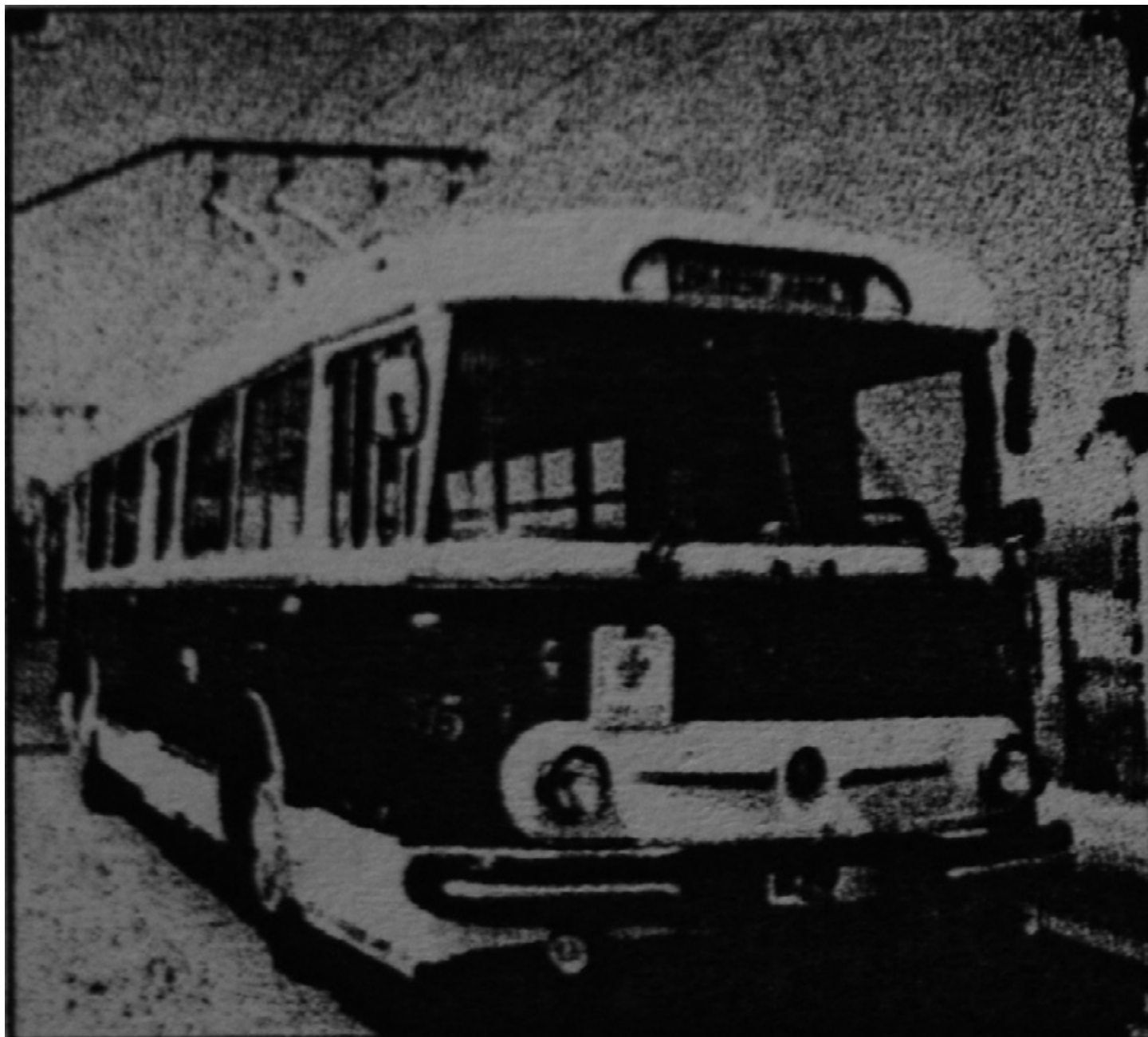
Trolejbusy typu 9Tr se v teplických ulicích objevily roku 1962. Jeden z nich, označený jako 105, po rekonstrukci slouží i nyní na nostalgické lince č. 11 a při mimořádných jízdách.