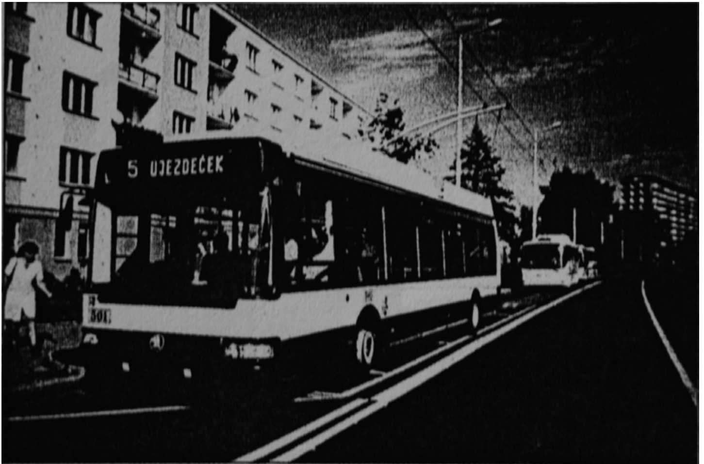
Na linkách MHD v Teplicích byl též nedávno úspěšně testován nový typ plzeňského trolejbusu – 24Tr IRISBUS.