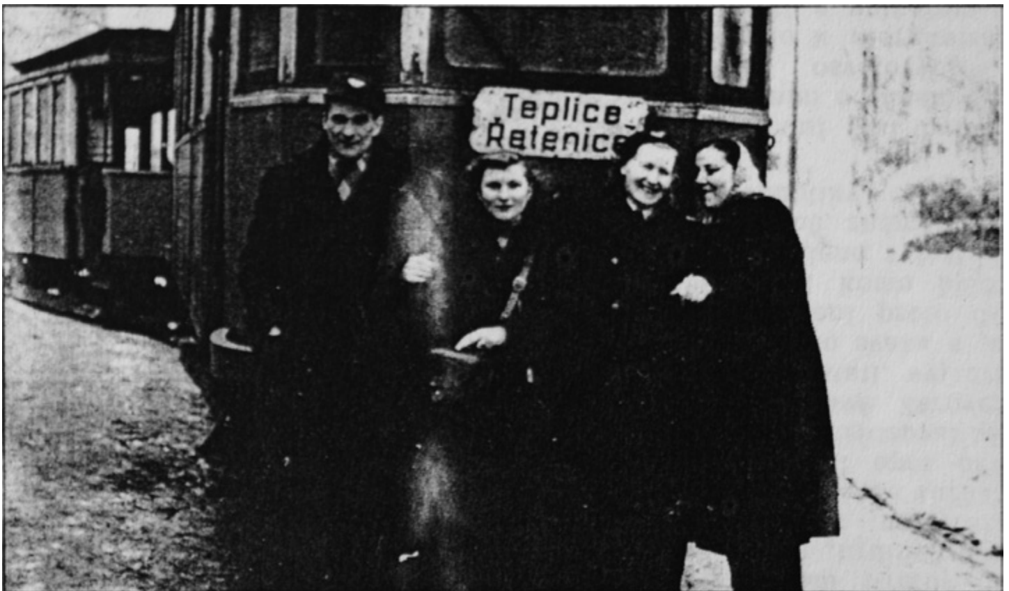
Snímek z roku 1953 je z konečné tramvaje v horním Dubí, kde se nechaly osádky tramvají vyfotografovat. Výrazná je směrová tabule, neboť tramvajová linka č. 1 jezdila z Horního Dubí přes Teplice až do Řetenic.