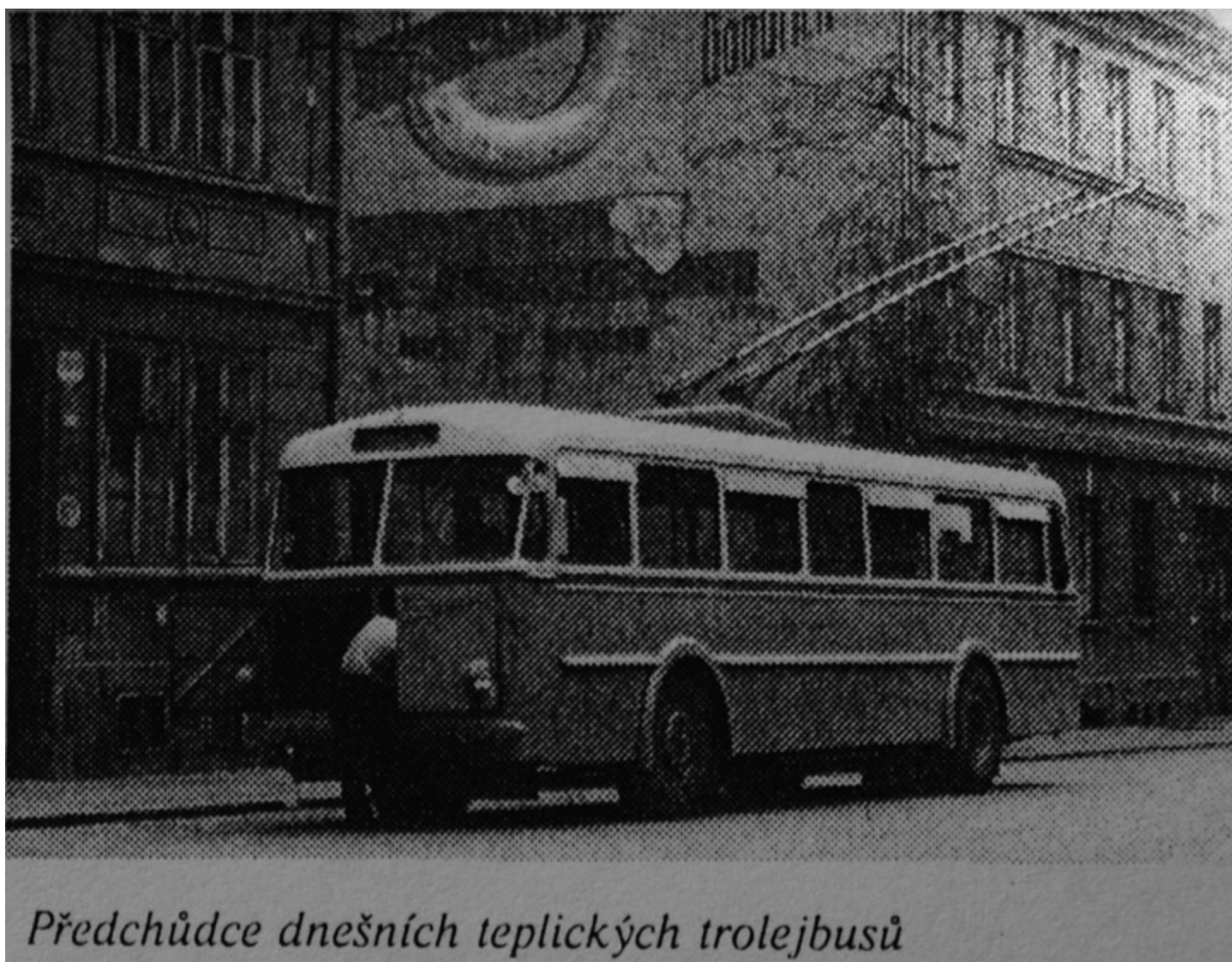
Předchůdce dnešních teplických trolejbusů

Postupně, během let, se uváděly do provozu další trolejbusové úseky, zejména za rušené tramvaje. Po jisté stagnaci a útlumu rozvoje koncem šedesátých a dále v sedmdesátých letech, došlo na počátku let osmdesátých k renesanci trolejbusů ve městě. Přišly nové vozy, rekonstrukcí prošla elektrická zařízení a přistoupilo se k další výstavbě nových trolejbusových směrů. K původním trasám tak v posledních letech přibýly úseky do Zemské ulice, k Sometu, Angru, do Prosetic, Šanova II a trať přes Jateční ulici.