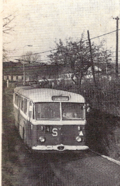
U NĚKTERÝCH TROLEJBUSŮ TR 8 BYLA PŘEVEDENA GENERÁLNÍ OPRAVA A SLOUŽÍ DO DNES.