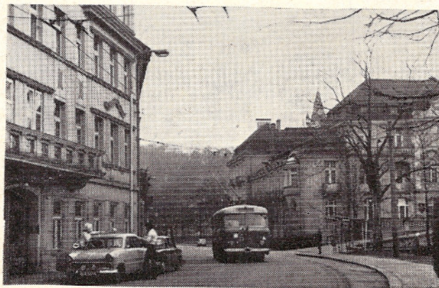
LÁZEŇSKÝM ŠANOVEM PROJÍŽDĚJÍ TROLEJBUSY JIŽ OD ROKU 1952. NA SNÍMKU JE STARŠÍ TYP VOZU ŠKODA TR 8.

Přes všechny tyto potíže vyjely 1. března 1956 trolejbusy na nové linky z Trnovan k Zámecké zahradě, do Křtenic a Újezděčka, čímž začala plánovaná likvidace tramvajů. Tehdy byla zrušena okružní trať č. 11, která bývala ztrátová, zejména v úseku „ulice Josefa Hory — Jankevova“. Trať končila už na nové smyčce v Ša-